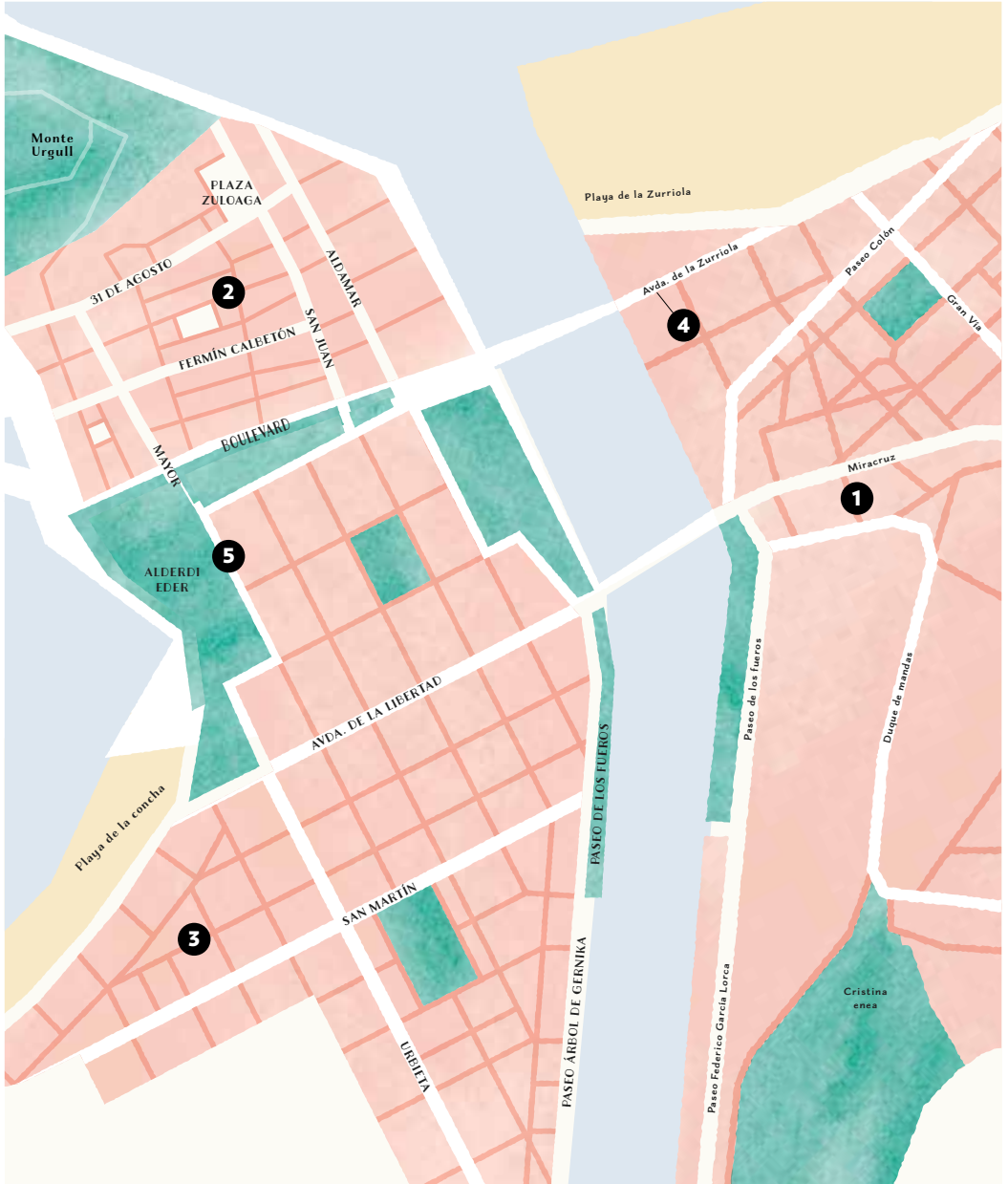
1. ARTEKO, Iparragirre 4. - 2. EKAIN ARTE LANAK, Iñigo 4. - 3. IÑIGO MANTEROLA GALERIA DE ARTE, Zaragoza Plaza 3, bajo. - 4. KUR ART GALLERY, Zurrriola hiribidea 6. - 5. CIBRIÁN GALLERY, Hernani 21.