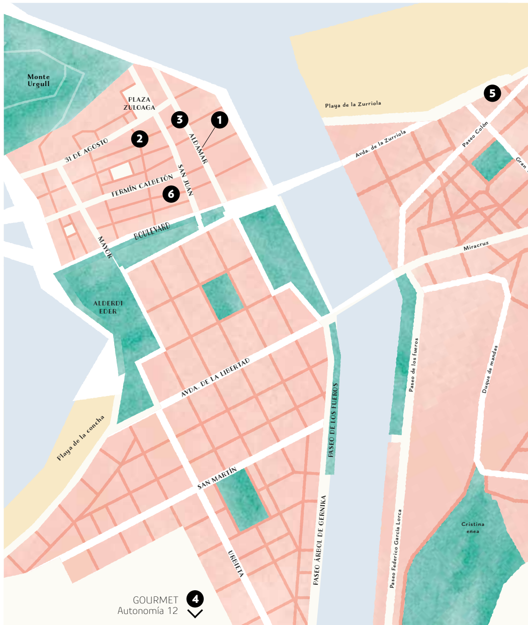
1. AITOR LASA GAZTATEGIA, Aldamar 12. - 2. CHOCOLATERIA ARAMENDIA, Narrika 22. - 3. GOÑI ARDOTEKA, Aldamar 3. - 4. GOURMET, Autonomía 12. - 5. KAÑABIKAÑA, Zurriola hiribidea 36. - 6. LA SEVILLANA, San Lorenzo 6.