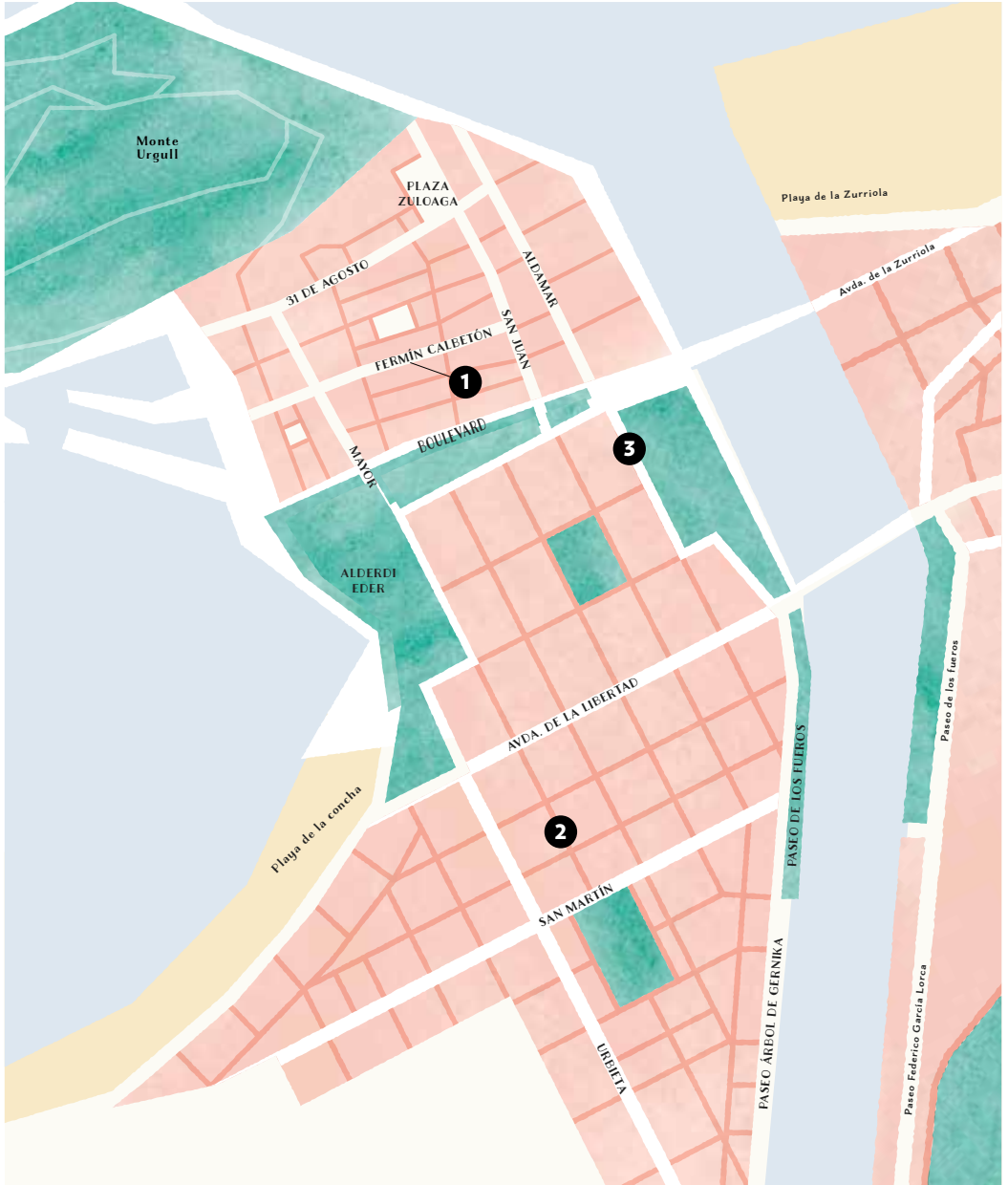
1. ELKAR, Fermin Calbetón 21. - 2. FNAC, CC San Martín - Urbieta 9. - 3. HONTZA, Okendo 4.